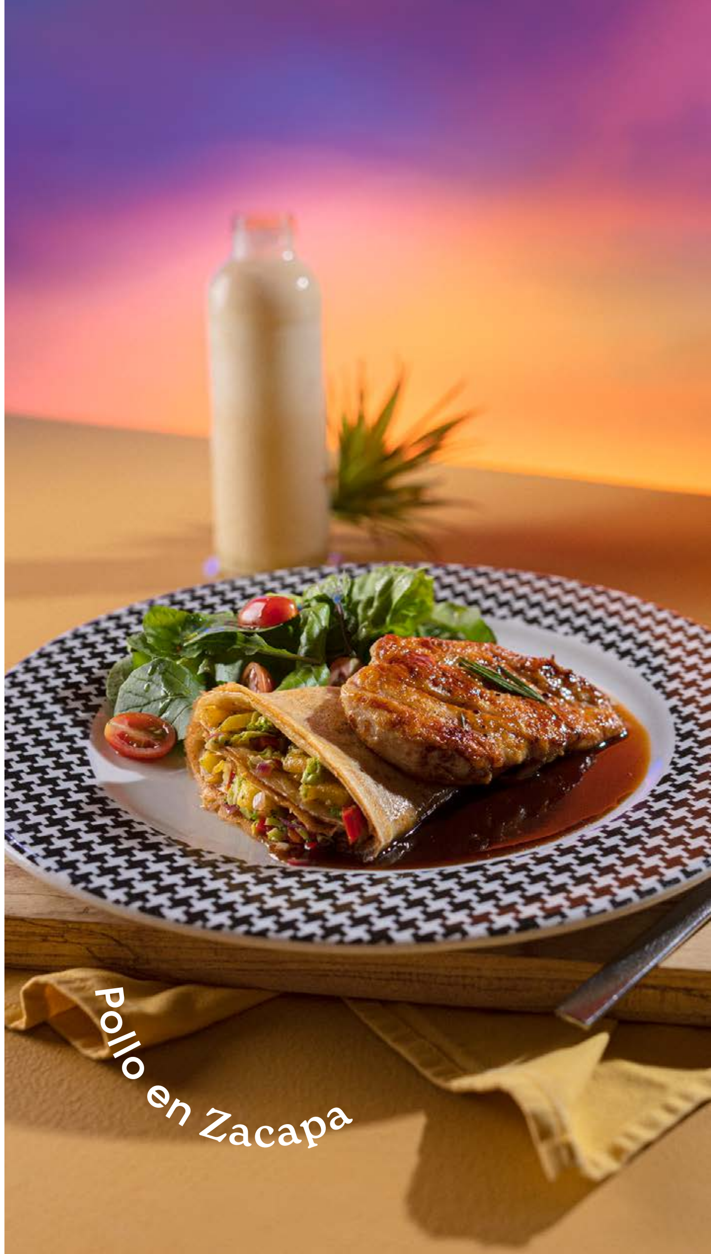
Pollo en Zacapa