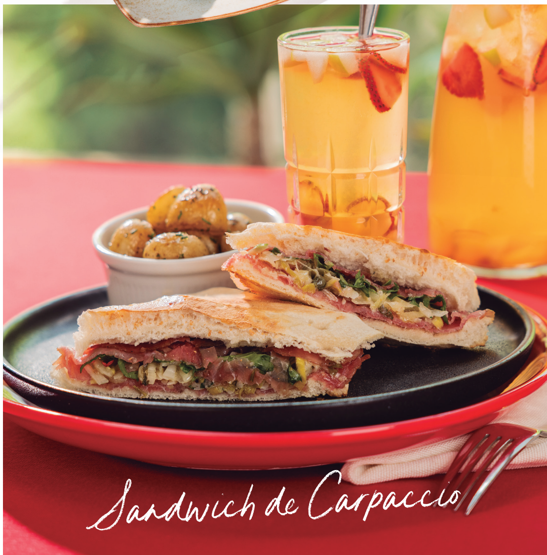
Sandwich de Carpaccio